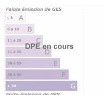
DPE ANCIENNE VERSION